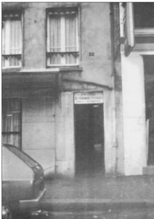
Entrada do prédio em que está situada atualmente a Sociedade Francesa de Estudos de Fenômenos Psíquicos.