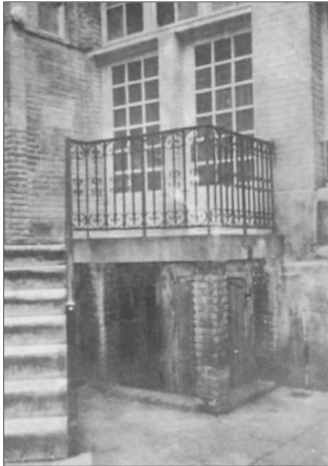
Fundos do prédio da Sociedade Francesa de Estudos de Fenômenos Psíquicos, com vista parcial do salão de reuniões.