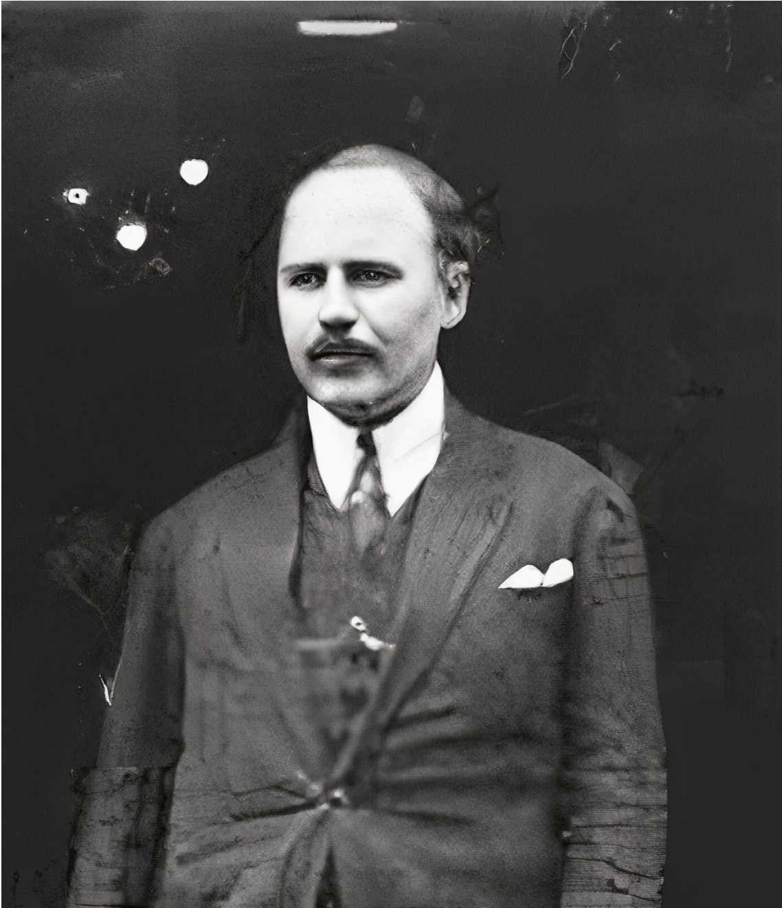
PAUL BODIER (1874 – 1946)