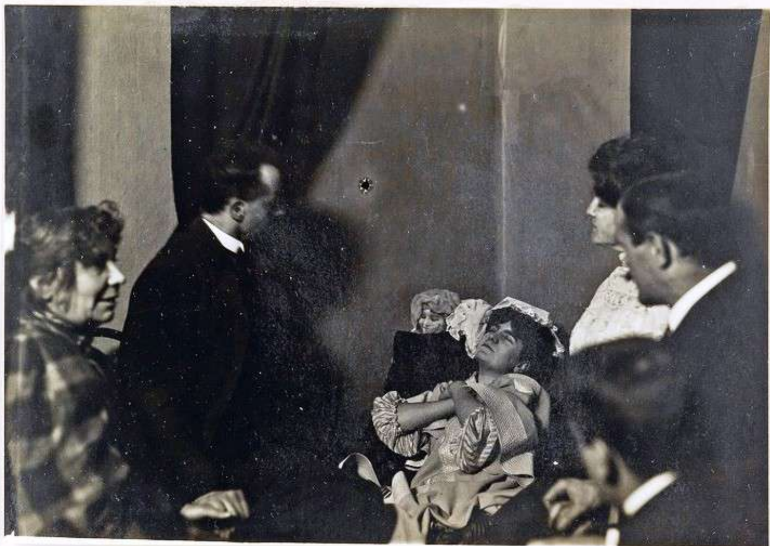
Seduta del 31 dicembre 1908. - (Da negativa 13 X 18).