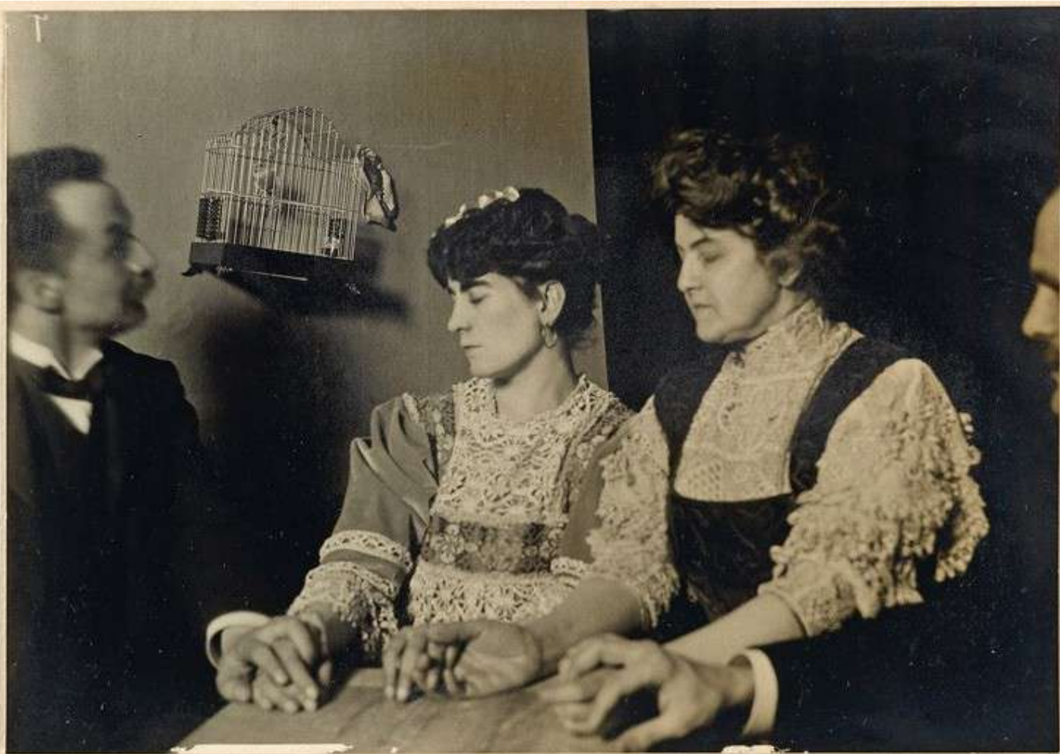
Seduta del 31 gennaio 1909. (Da negativa 13 X 18).