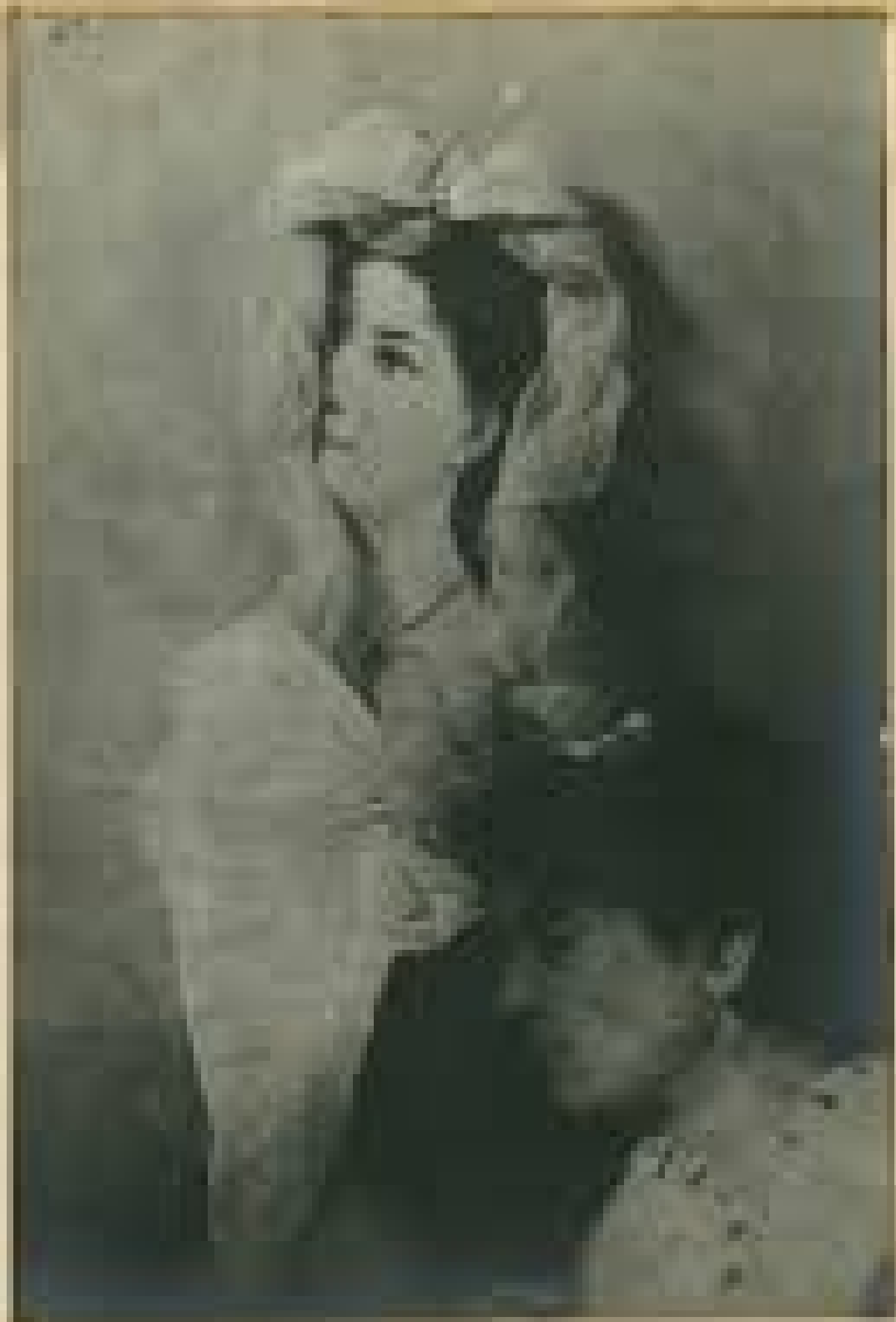
Portrait of a woman, 1911. (The artist's name is not known.)