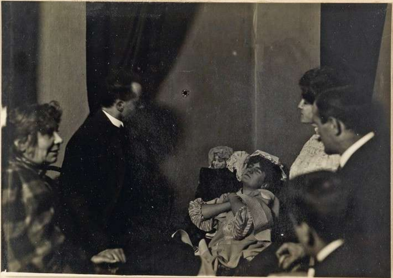
Seduta del 31 dicembre 1908. - (Da negativa 13 X 18).