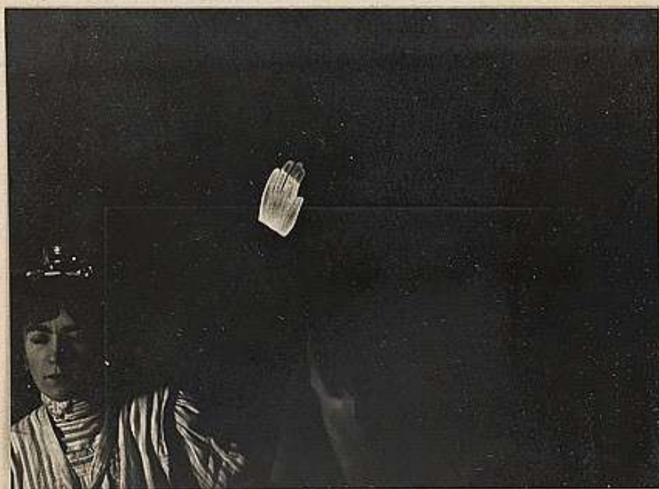
Seduta del 12 novembre 1908. - (Da negativa 9X12).

Domanda di collocare nel gabinetto per le prossime sedute,