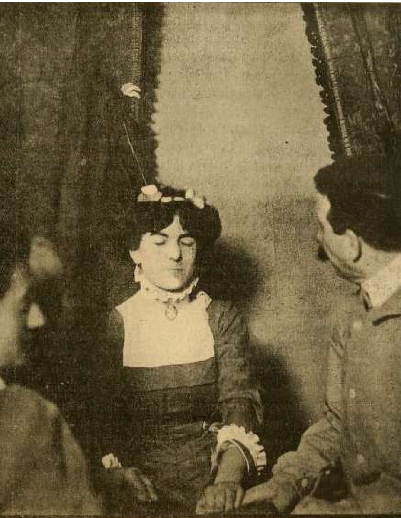
Paris, 19 avril 1909. - Cl. 1687.