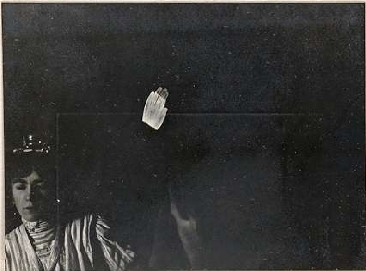
Seduta del 12 novembre 1908. - (Da negativa 9 X 12).